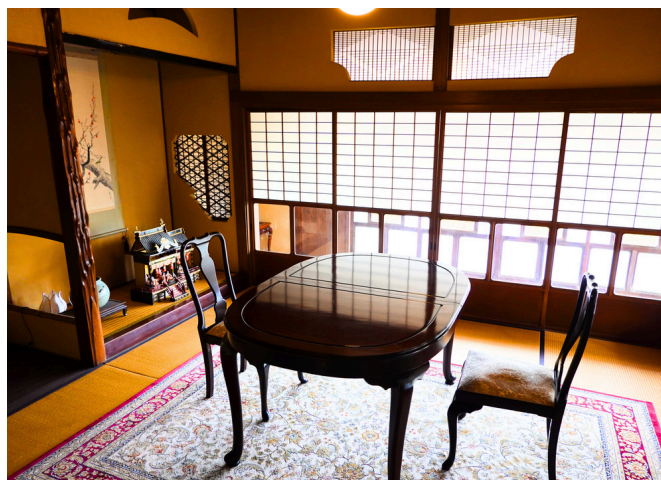
■ 1階 一の間 (2名和室)