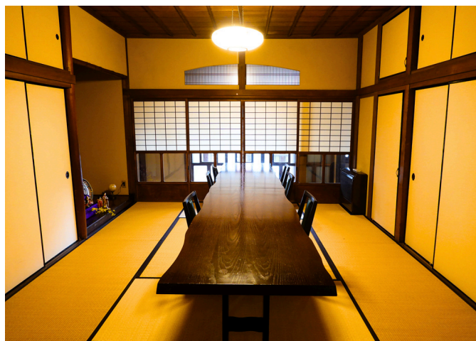
■ 1階 三の間 (8名和室)