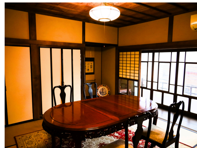
■ 1階 五の間 (4名和室)